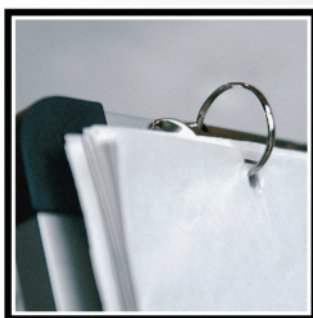
Senza ruote - w/o casters