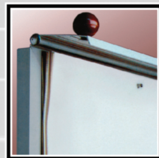
Fermablocco a molla Spring Assisted Pad Clamps